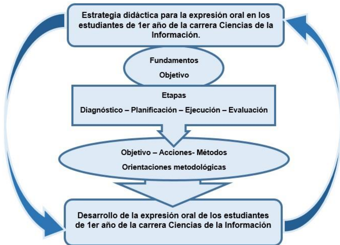
Fig. 1. Representación gráfica de la estrategia didáctica para contribuir a la expresión oral de los estudiantes de Ciencias de la Información.