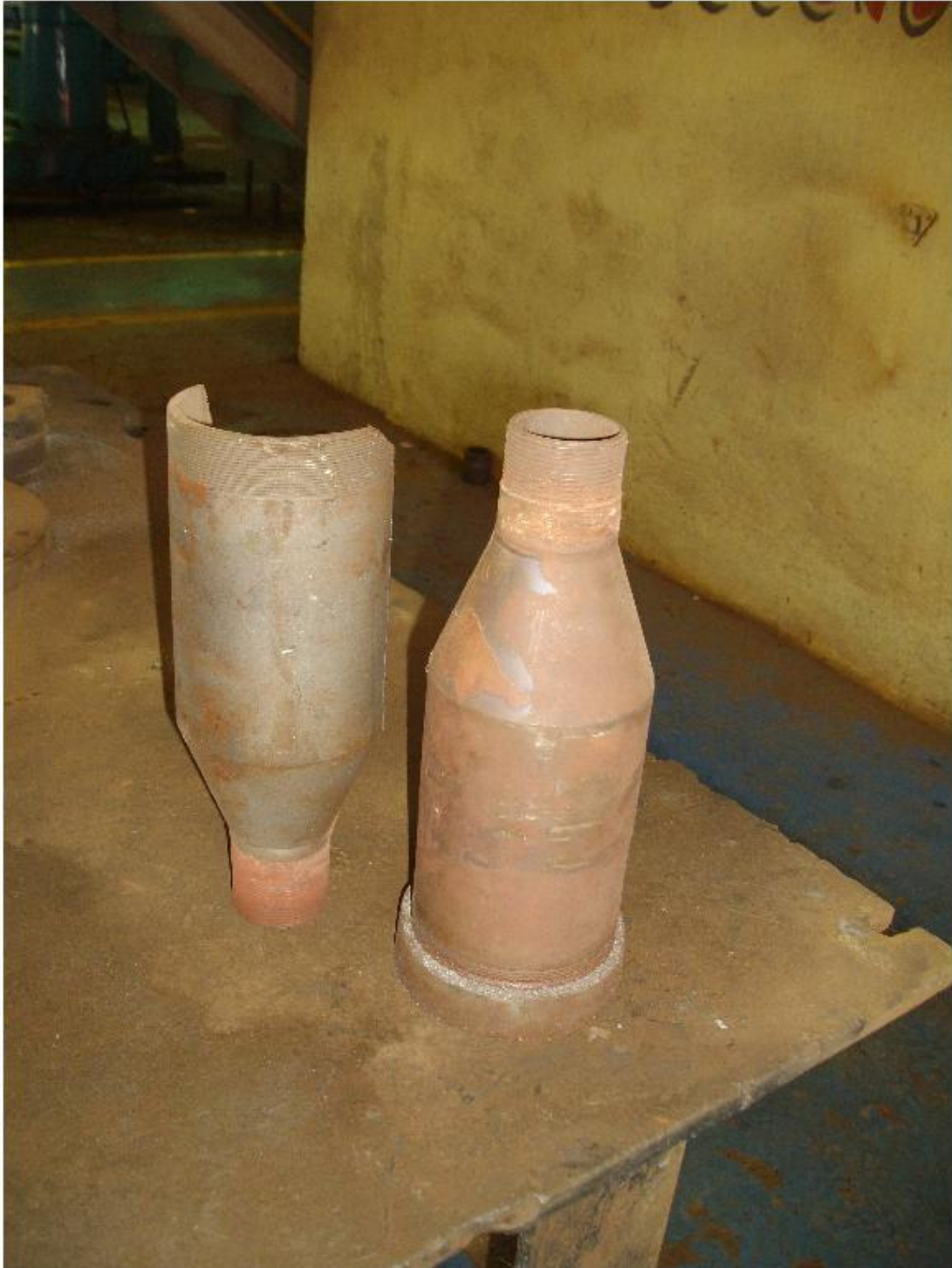
Imagen 2. Copas de vapor de agitación