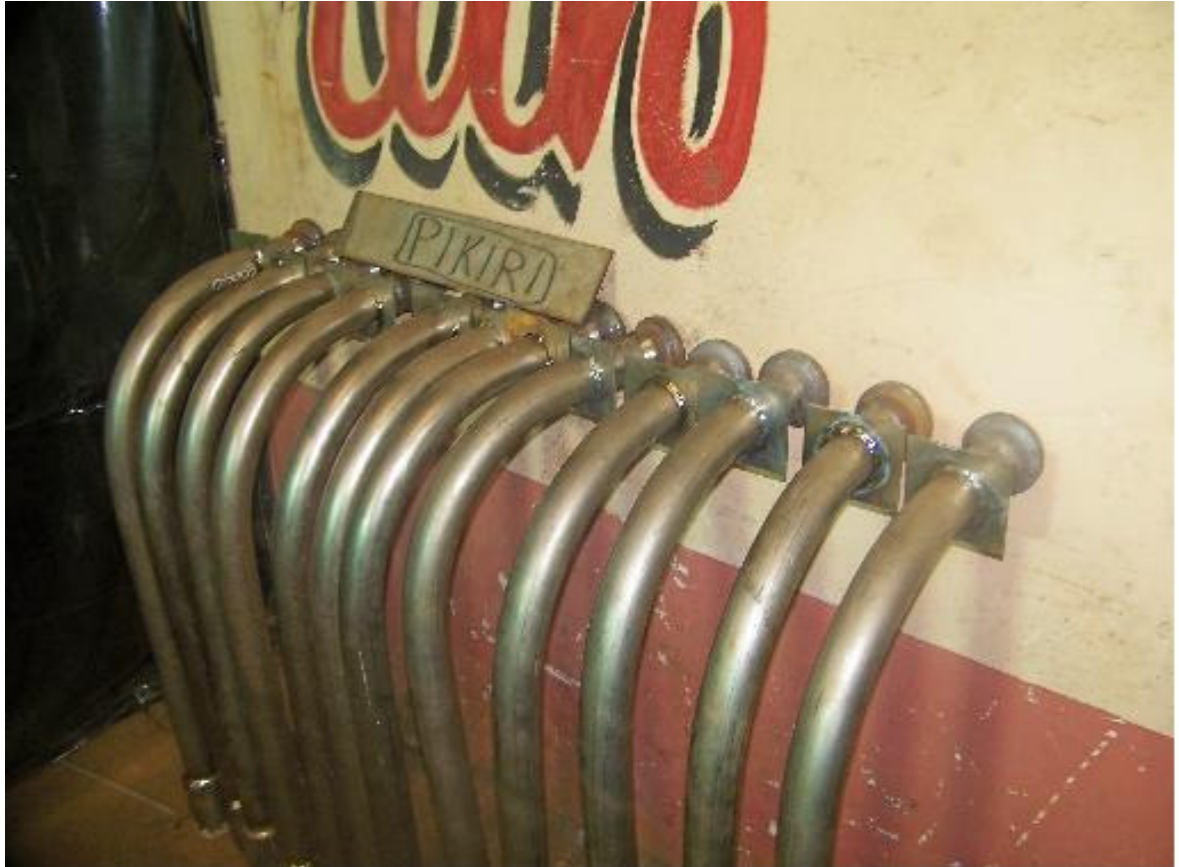
Imagen 3. Codos de vapor de agitación