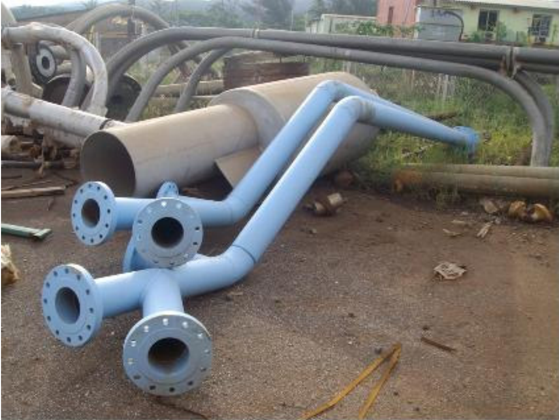
Imagen 1. Y de descarga de bombas Wirth