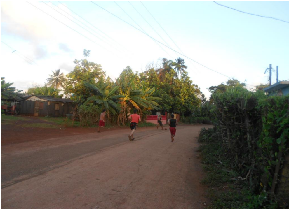
Jóvenes de la comunidad de Cabaña practicando deporte