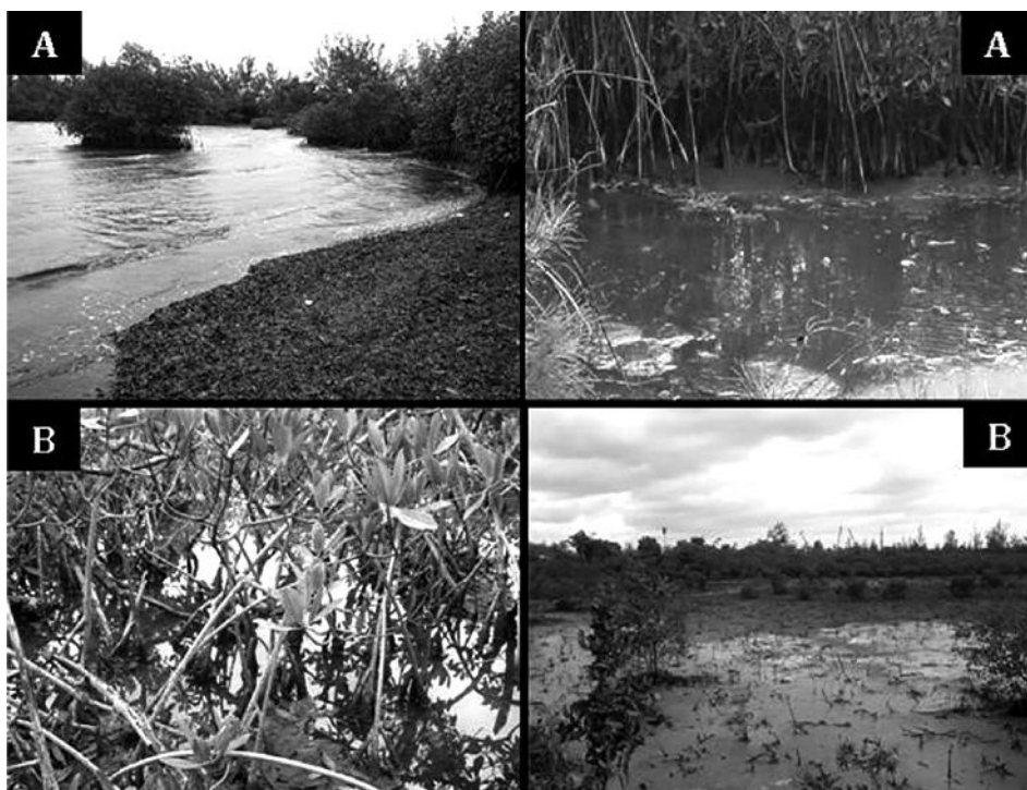
Figura 3. Imágenes de zonas impactadas con hidrocarburos del petróleo provenientes de las empresas asentadas en el puerto. Manglar (A), Marisma (B).

la acumulación de residuos. A su vez las aguas superficiales y subterráneas están influenciadas por el vertido de aguas residuales producto de las actividades humanas, vertido de aguas y líquidos industriales, emisión de contaminantes y acumulación de residuos.