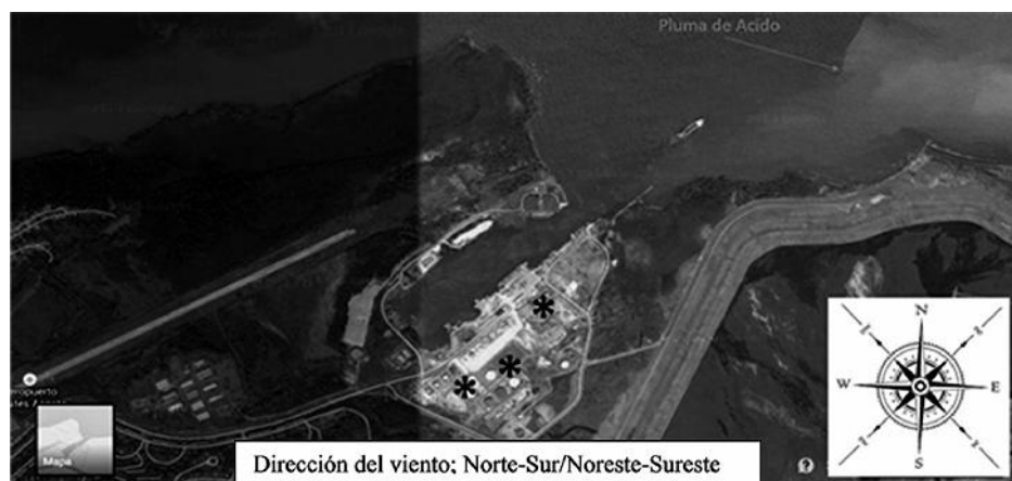
Figura 1. Imagen aérea de la ubicación del Puerto Moa/ *Focos de contaminación identificados referentes a la actividad portuaria.

Para llevar a cabo la caracterización de la zona de estudio, se realizó un análisis de la infraestructura, actividad socioeconómica y movimientos de insumos, así como posibles focos de contaminación (figura 1). También se identificaron los potenciales impactos que son generados al ambiente, seleccionando los componentes interactuantes. Así como el conjunto de elementos ambientales del entorno físico, biológico y socioeconómico-cultural, que intervienen en dicha interacción según Milán, 2004.