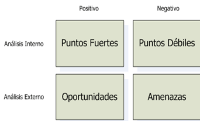
Figura 1.2: Esquema Simplificado de Matriz DAFO

Una vez descrito las amenazas, oportunidades, fortalezas y debilidades de la organización se puede construir la Matriz DAFO, matriz que permite visualizar y resumir la situación actual del objetivo a estudiar. La que se puede representar por medio de cuatro cuadrantes los cuales pueden ubicarse en un eje de coordenada representando aspectos positivos y negativos para la organización los cuales debe seguir bien de cerca, como se ilustra a continuación en la siguiente figura (1.2).