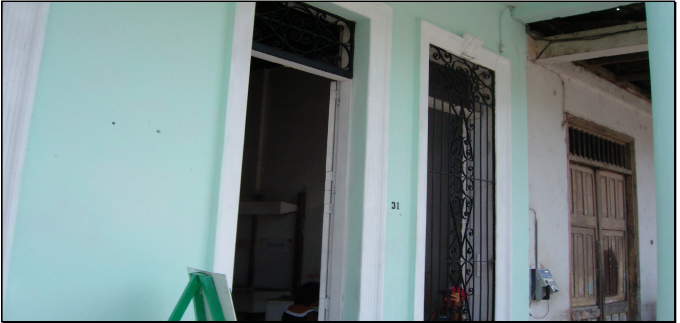
Museo Histórico Municipal Sagua de Tánamo.