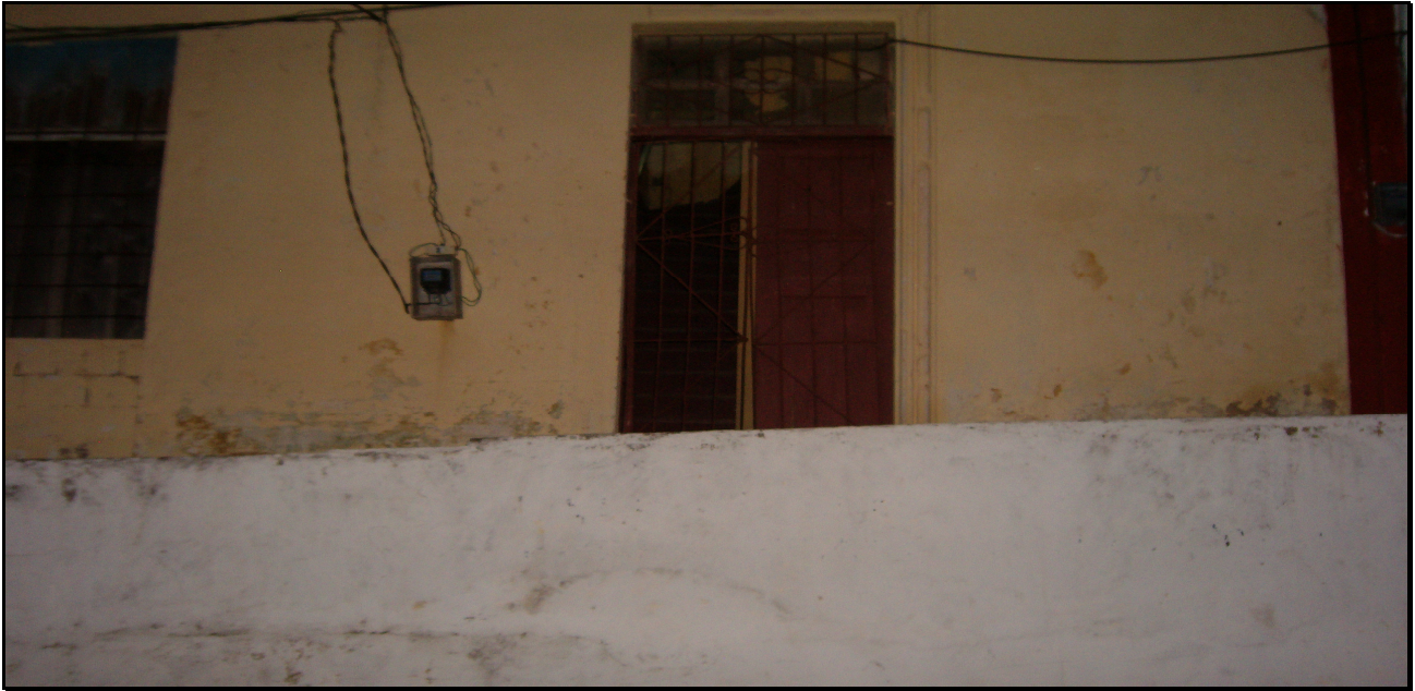
Escuela Juana Bastard