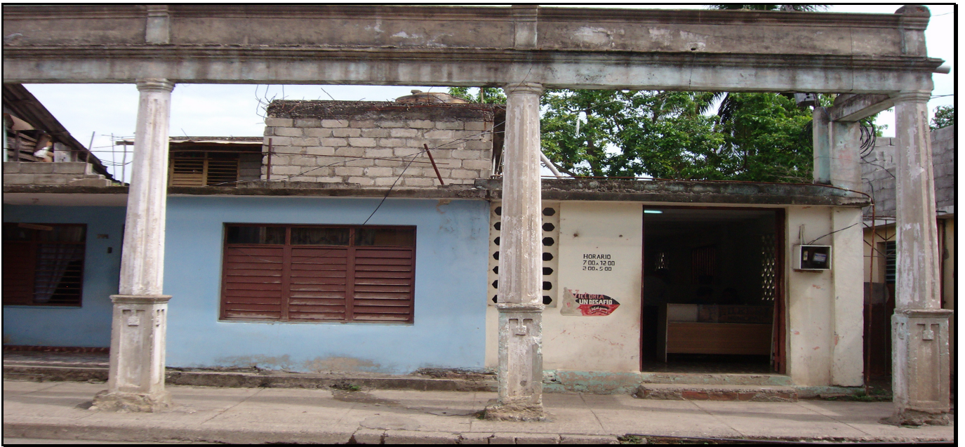
Local de Impresión del Periódico “La Opinión”