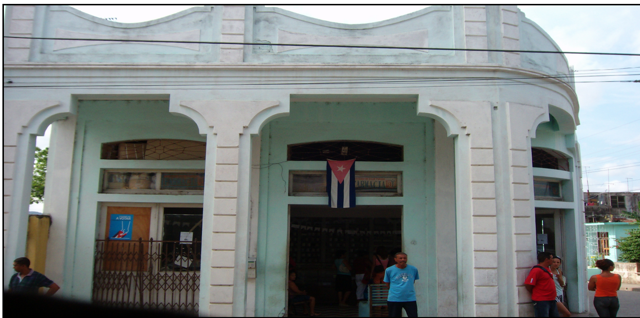
Farmacia Piloto de Turno Permanente.