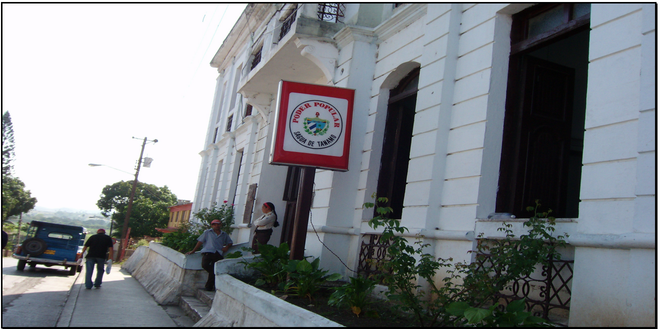
Sede del Gobierno Municipal