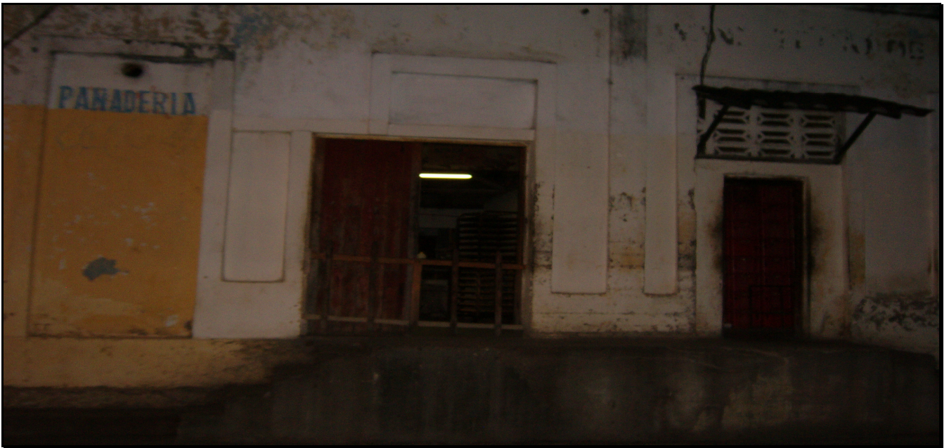
Panadería La Gloria