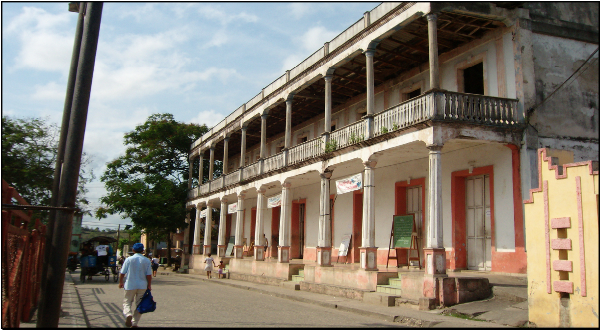
Casa de Cultura