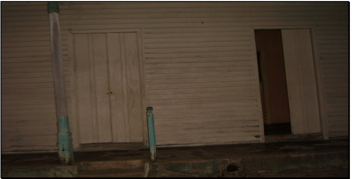
Casa de Doctor Ángel Server Quevedo