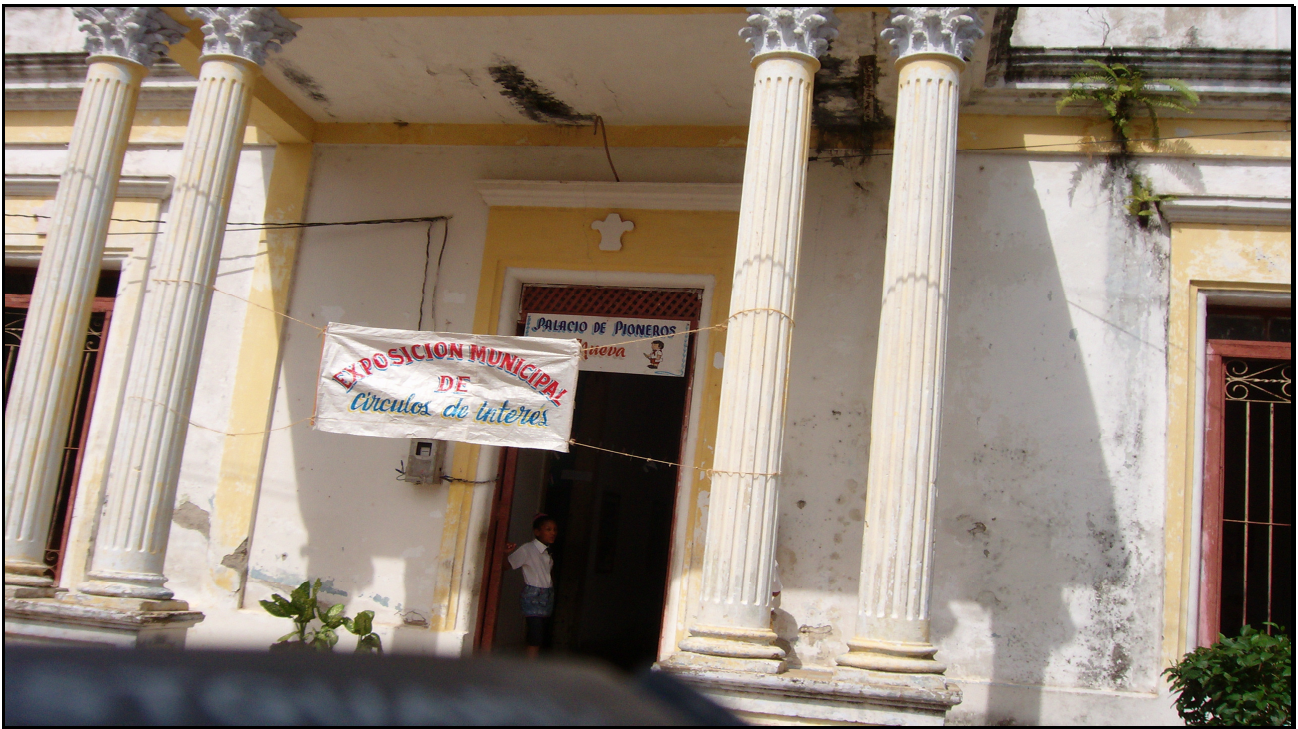
Palacio de Pioneros