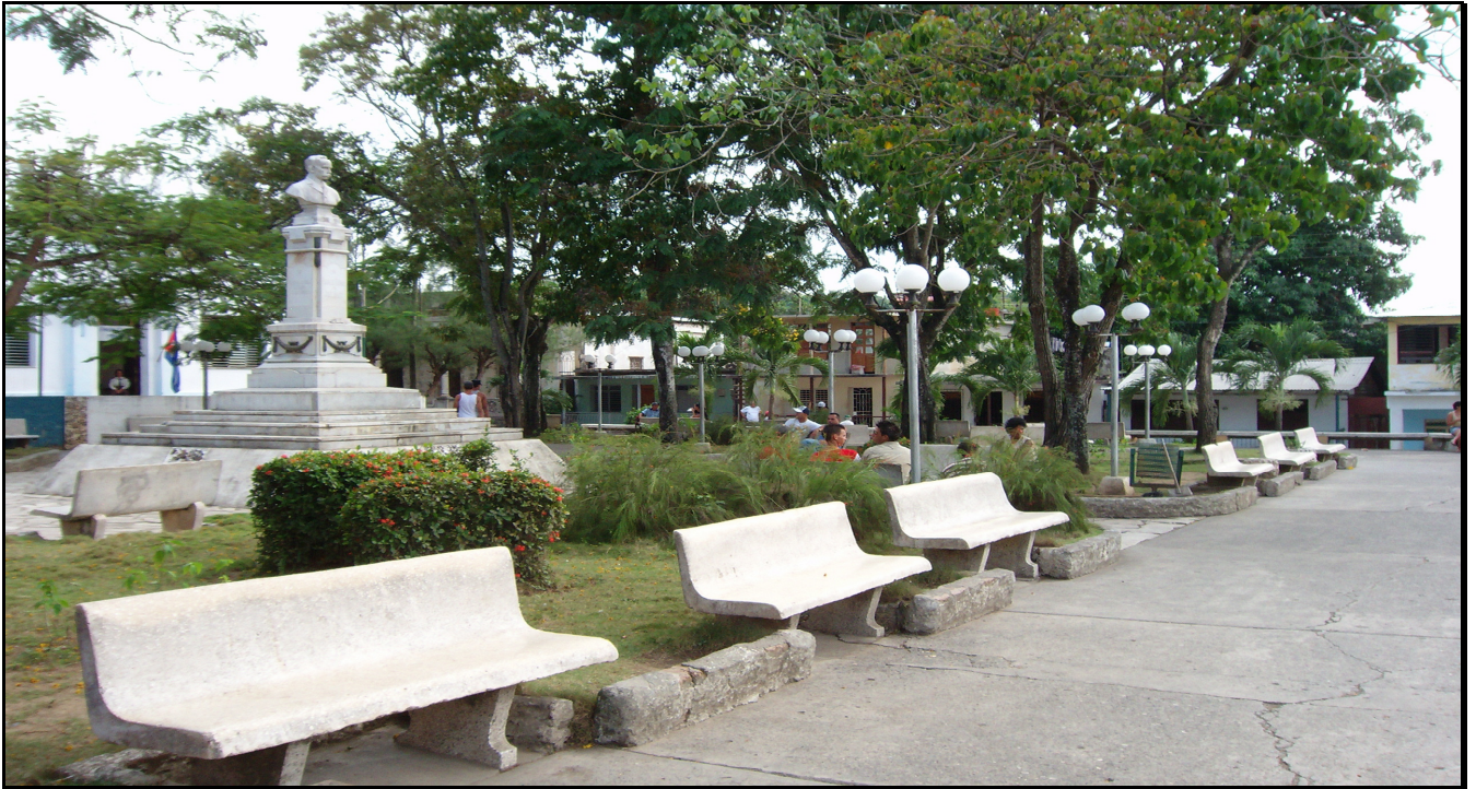
Parque José Martí