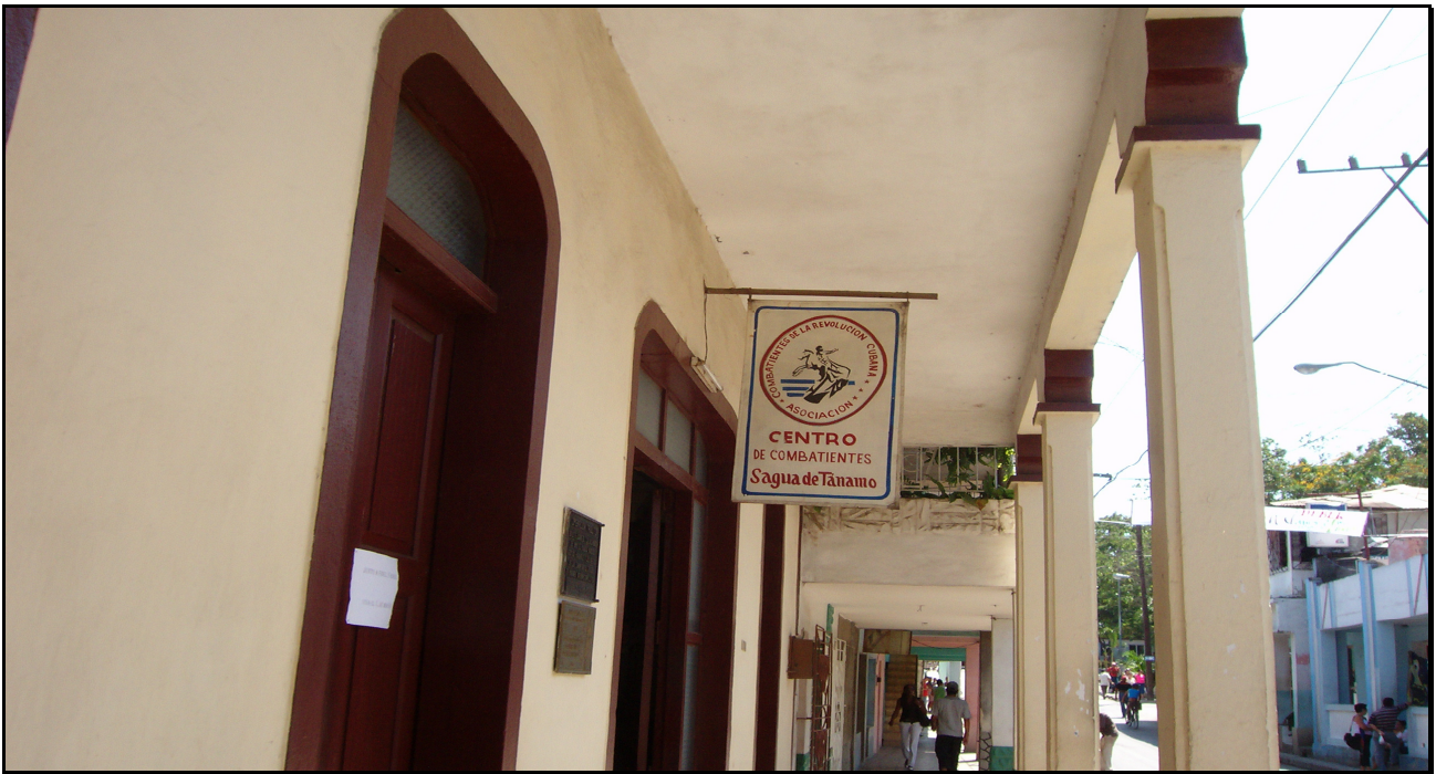
Centro de veteranos