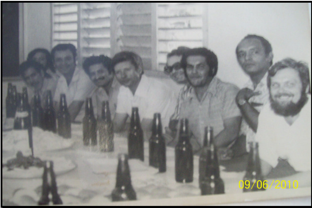
Festejo por el Día Internacional de la Mujer 8/03/1981.