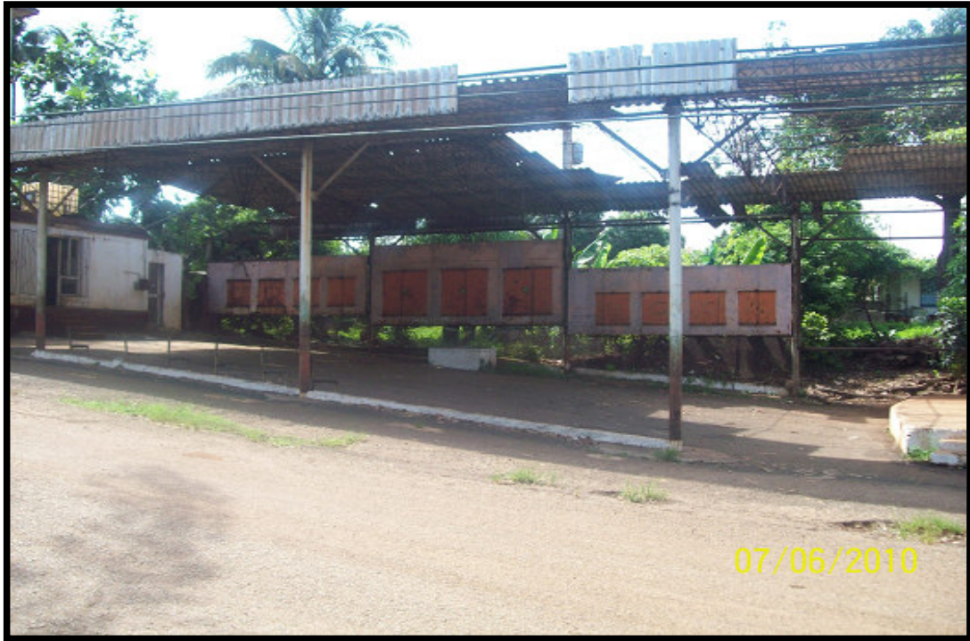
Área recreativa, hoy punto de venta de gas licuado.