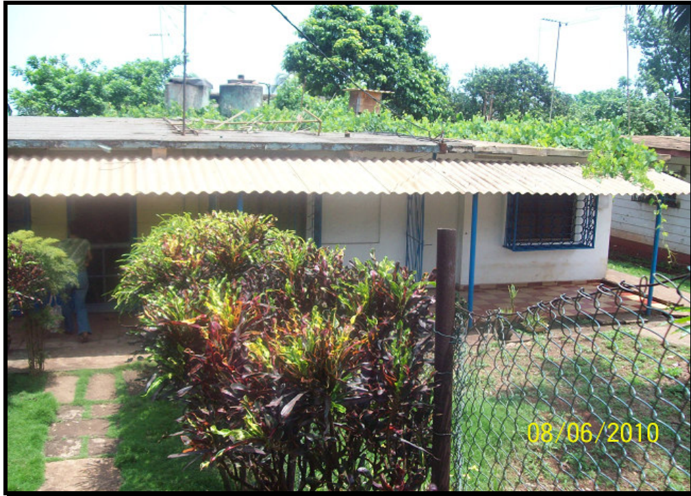
Escuela para niños, hoy Policlínico de Rolo Monterrey

Sitio donde radicaba el Consulado Soviético, hoy vivienda familiar. (Calle 7 ma No. 129)