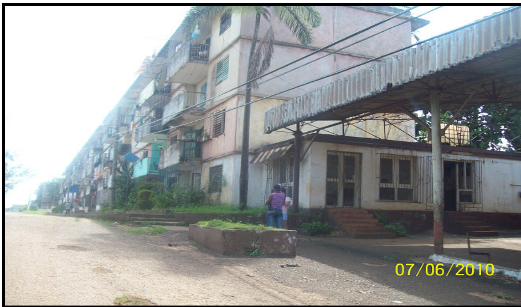
Mercado comercial, hoy El Martillo

Cadena de edificios donde radicaban los colaboradores soviéticos. (Edif. 13, 14, 15, 16, etc.)