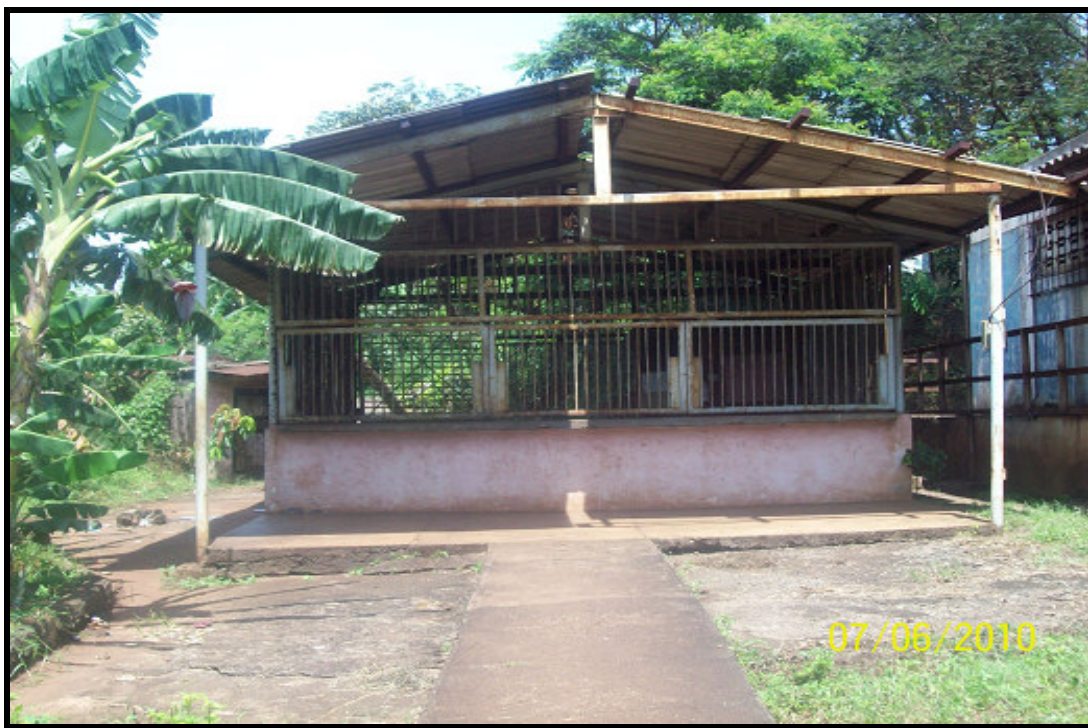
Área deportiva, junto a la escuela para niños