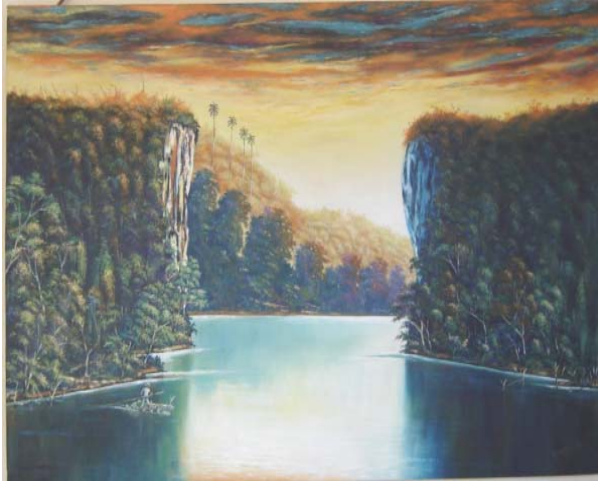
Título: Cañón del Yumurí Técnica: Óleo/lienzo Autor: Pedro Pablo B. Carballo.