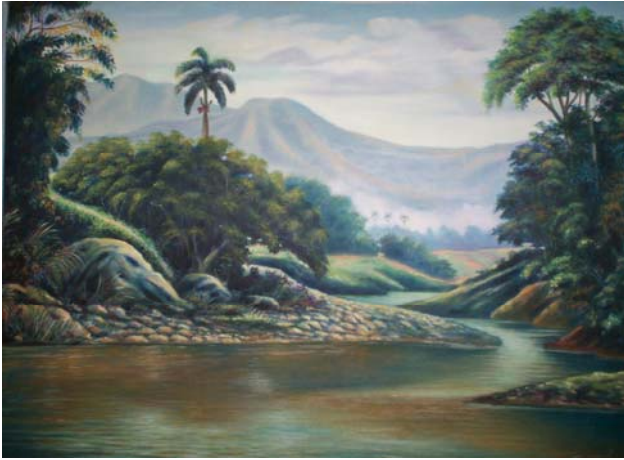
Título: Río Santa Catalina. Técnica: Óleo/lienzo Autor: Pedro Pablo B. Carballo.