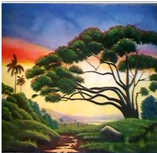
Título: El Ocaso (2007)