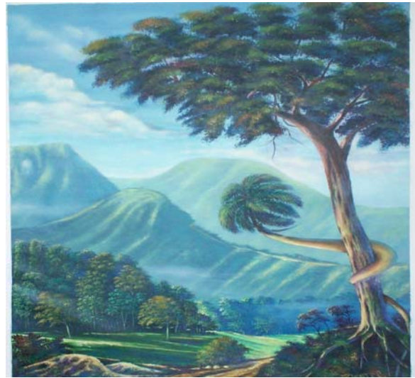
Título: El tiempo y el viento Técnica: Óleo/ lienzo Autor: Pedro Pablo B. Carballo