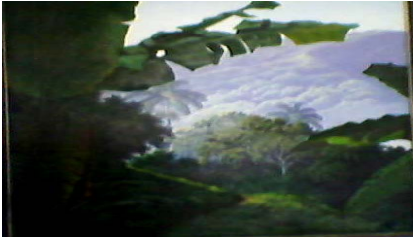
Título: Paisaje (1987)

Es uno de los artistas plásticos más significativo de la cultura del municipio Sagua de Tánamo. Sus obras evidencian la temática del paisaje, en la técnica de óleo/lienzo. Algunas de sus obras se encuentran en diferentes galerías de arte como la ciudad de Moa, Baracoa, Santiago de Cuba y Sagua de Tánamo donde ha obtenido grandes premios.