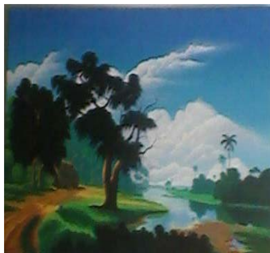
Título: Retorno al palmar (2007)