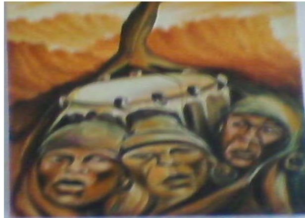
Título: Tumba Francesa a la media noche Técnica: Óleo/lienzo Autor: Pedro Pablo B. Carballo.