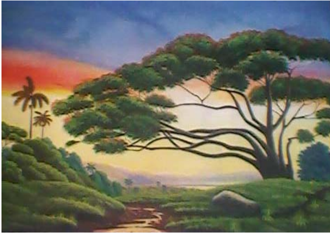
Título: El Ocaso Técnica: Óleo/lienzo Autor: Franklin Mayan.