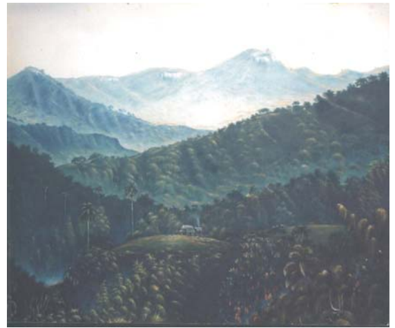
Título: Amanecer en el cafetal Técnica: Óleo/lienzo Autor: Pedro Pablo B. Carballo