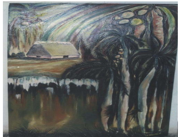
Título: Cuba canta Técnica: Óleo/lienzo Autor: Pedro Pablo B. Carballo.