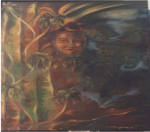
Título: Sombra que amenaza Técnica: Óleo/lienzo Autor: Pedro Pablo B. Carballo.