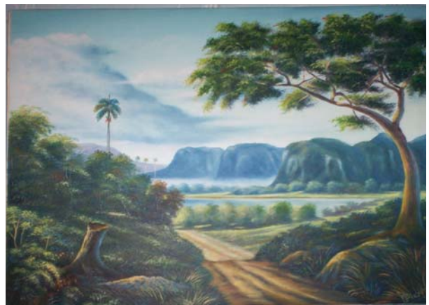
Titulo: Rumbo a Castro Técnica: Óleo/lienzo Autor: Pedro Pablo B. Carballo.