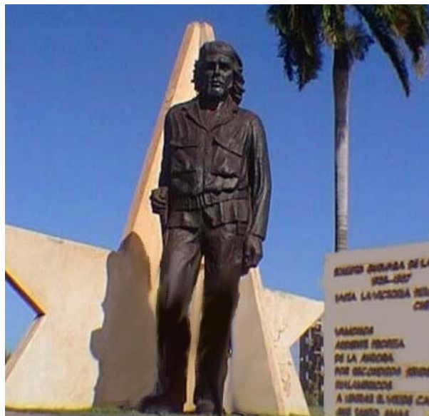
Guerrillero de América (1984)

En este parque se celebran las actividades patrióticas del reparto y se rinde homenaje a las fechas relacionadas con el mártir.