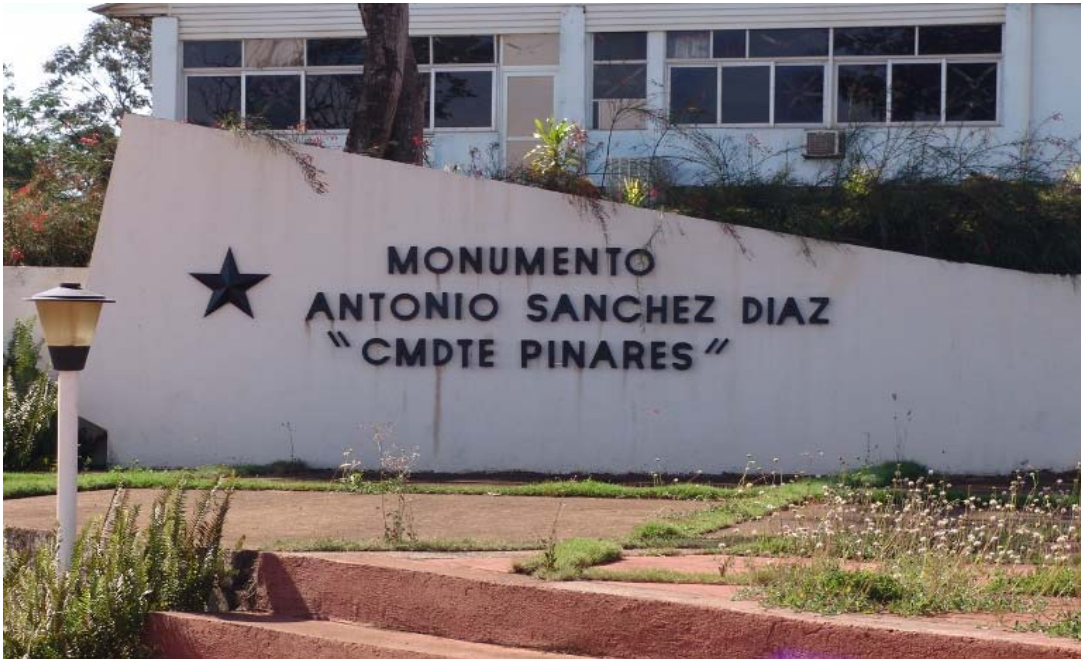
Detalle del conjunto escultórico (Comandante Pinares) (2002) Elena Baquero y Rogelio Gómez.