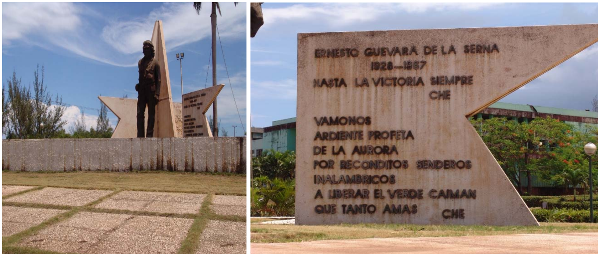
Conjunto y detalle del conjunto escultórico Guerrillero de América (1984)