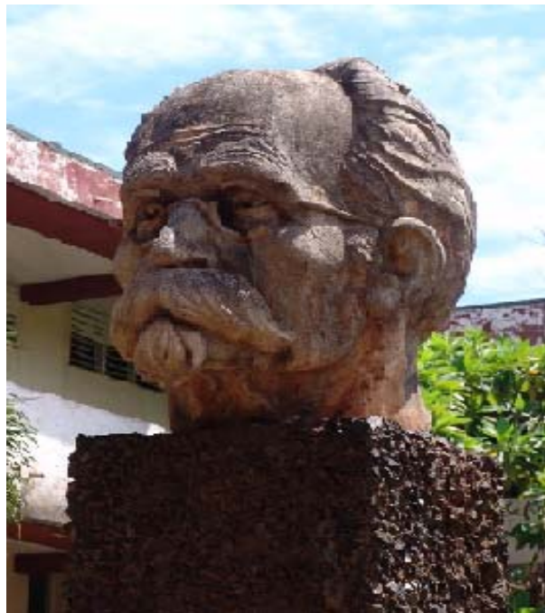
Busto Máximo Gómez (1988)