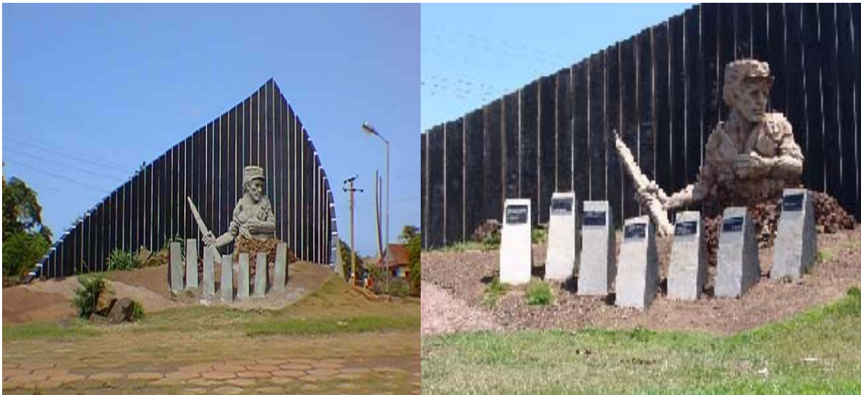
Conjunto escultórico Pedro Sotro Alba (1978)

Nota: La primera obra escultórica que se confeccionó en Moa fue hecha por el carpintero Bermúdez Fuentes Sanamé, que cuando en 1960 se solicitó a quien pudiera esculpir un busto de Pedro Sotro Alba para colocarlo en el parque que lleva su nombre, dio un paso al frente y esa fue la primera obra plástica hecha en Moa, réplica de la cual hizo una para situarla en la escuela de Manzanillo que lleva el nombre de ese expedicionario del Granma (Velazco; 2002)