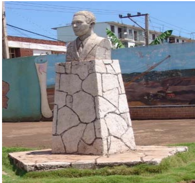
Busto del Comandante Pedro Sotto Alba (1960) Bermúdez Fuentes Sanamé.

Título: Busto del Comandante Pedro Sotto Alba.